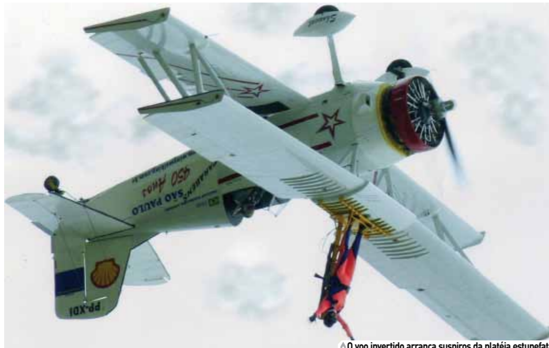
O voo invertido arranca suspiros da platéia estupefata

(operações) e um fiel escudeiro: o instrutor de voo e mecânico de aviões Ulisses Berggreen , responsável pela equalização, manutenção e perfeito funcionamento da máquina voadora. Tudo é exaustivamente ensaiado em solo antes do treino aéreo e milimetricamente calculado, uma vez que esse tipo de esporte não permite erros. O avião utilizado na performance foi gentilmente cedido por Gilda Bacaleinick , esposa do lendário piloto Ísio Bacaleinick , idealizador do livro "Nas asas do correio aéreo".