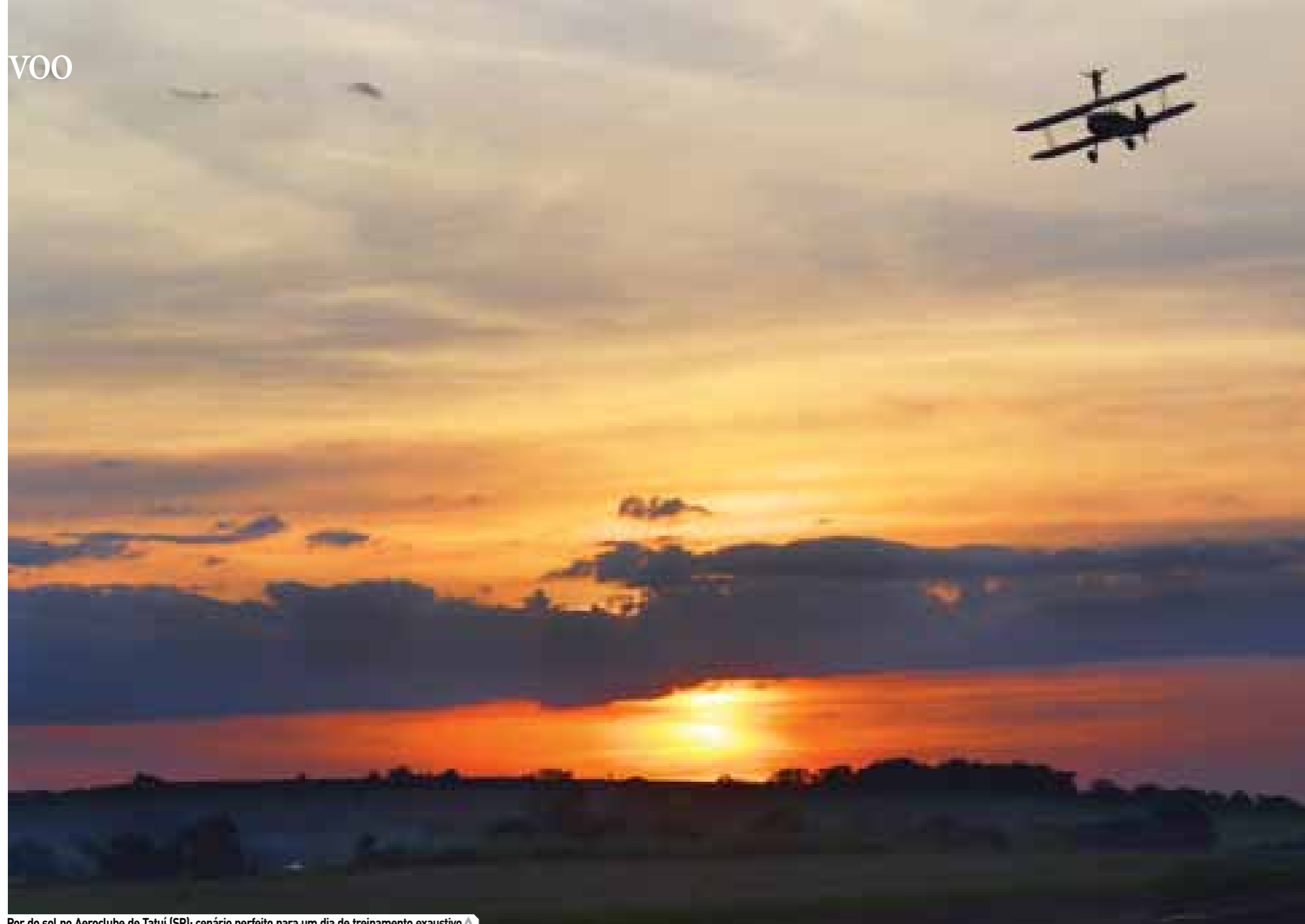
Por do sol no Aeroclub de Tatuí (SP): cenário perfeito para um dia de treinamento exaustivo