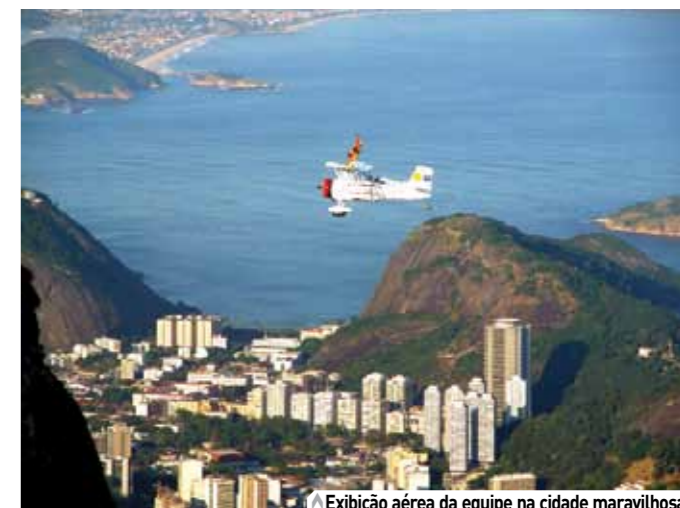
Exibição aérea da equipe na cidade maravilhosa