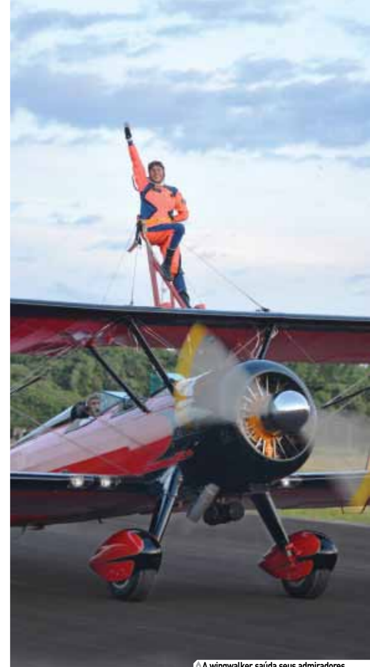
A wingwalker saúda seus admiradores