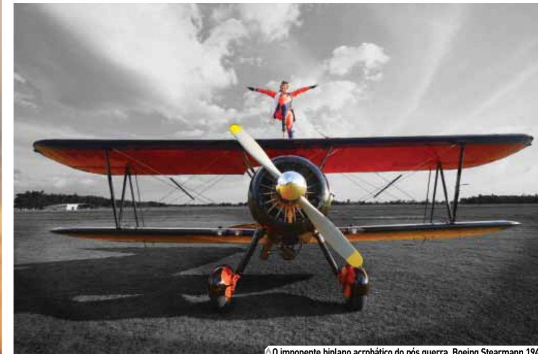
O imponente biplano acrobático do pós guerra, Boeing Stearman 1947