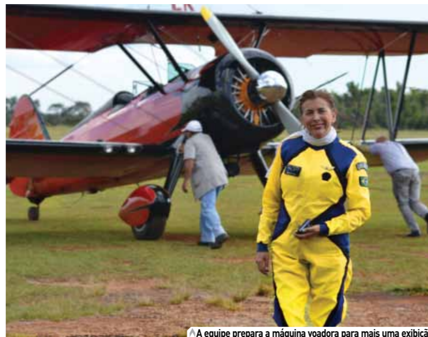
A equipe prepara a máquina voadora para mais uma exibição