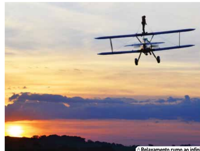
Relaxamento rumo ao infinito